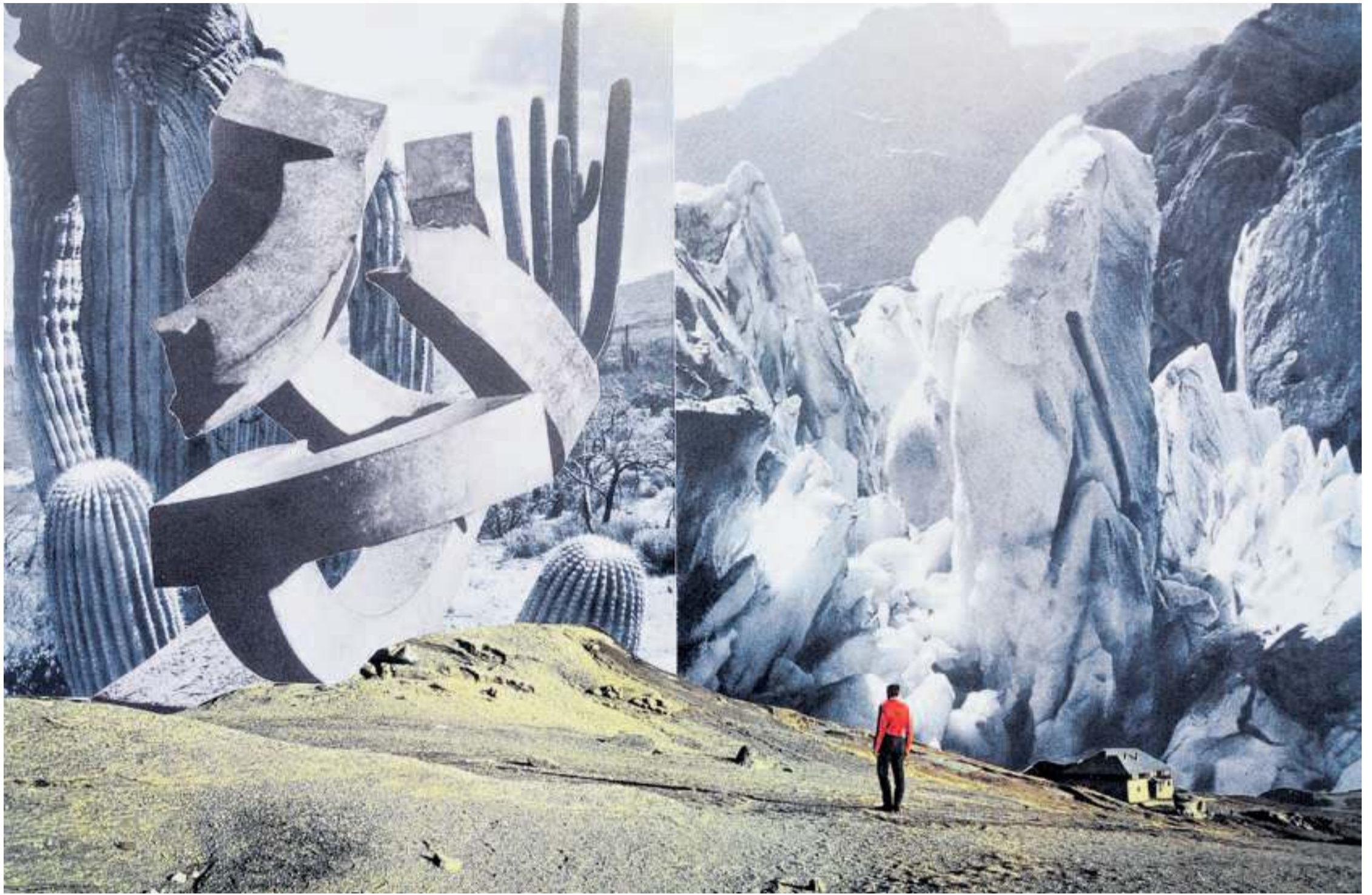
Eine surreal anmutende Landschaft der Luzerner Künstlerin Vanessa Piffaretti. Es ist auch ein verschmitzt-subtiles Spiel mit romantischen Bildauffassungen, in denen Erhabenheit zelebriert wird.