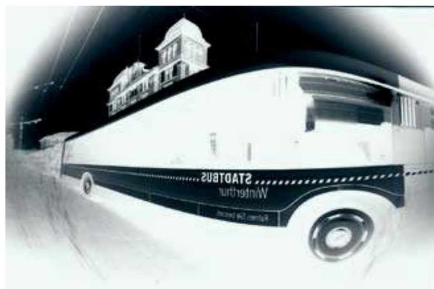
Ein Stadtbuss, mit der Lochkamera aufgenommen von Markus Birsfelder.

Mit dem belichteten Papier in der Büchse geht Birsfelder nach Hause, wo