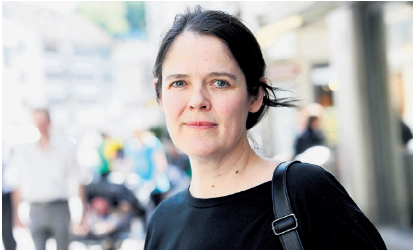
«Meine Werke bestehen aus einer Summe von Einzelteilen. Das ist platzsparend und macht es möglich, die Werke selber in einem Koffer zu transportieren.»

Ja und nein. Die Beschäftigung mit dem Körper hat mit Selbstwahrnehmung zu tun, mit dem Verhältnis des Ichs zur Umgebung. Es ging auch darum, über die eigene Wirklichkeit zu entscheiden, sich selbst zu definieren. In meinen Arbeiten ist mein Körper der Massstab. Ich probiere die textilen Skulpturen nicht an einer Puppe aus, sondern an mir selbst. Das heisst, meine Werke besitzen Verbindlichkeit, nicht nur zu einer speziellen Körpergrösse, sondern auch im Sinne von