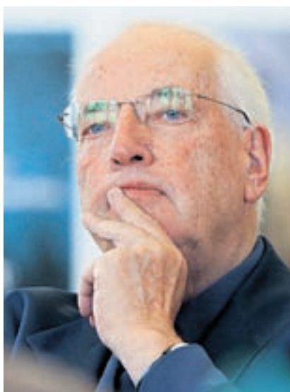
Produktiv: Peter Schamoni.

MÜNCHEN. Mit dem Film «Zur Sache, Schätzchen» wurde der Regisseur und Produzent Peter Schamoni berühmt. Im Alter von 77 Jahren ist er in München am Dienstag gestorben.